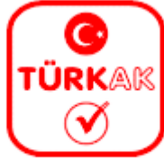
Şekil 1: TÜRKAK Logosu

TÜRKAK Logosu: TÜRKAK'ın kendi ismini veya akreditasyon programlarını tanıtmak için kullandığı sembol.